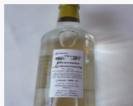
Provenve Kräuteressig / 500 ml 2.80EUR